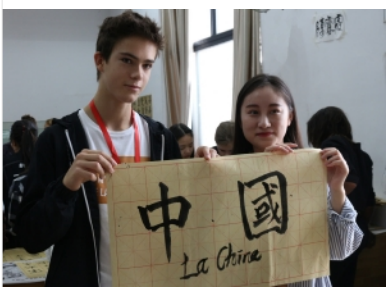
西语学院中法文化交流周

学校继续加强校园环境国际化建设，提高环境育人的效果。更多的学生不出国门就能在校园体验到多元的国际元素，也让各国留学生在这里感受到“家”的温暖。学校有针对性地建设校园宣传栏、广播台、英文网站等媒介，在广播台增设10大语种节目，在官微推出“多语种空中课堂”“学在海外”等栏目，在校报开设英文板块等特