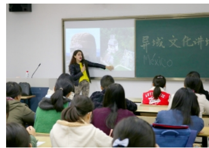
商学院异域文化讲堂

办好异域文化讲堂。商学院充分利用自身资源，邀请留学归来的教师及外教、留学生分享异域文化，开阔了同学们的国际视野，提升了学生的跨文化