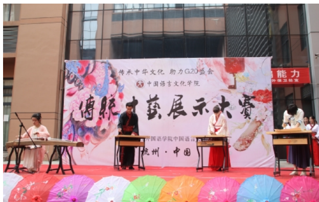
中文学院传统艺术展示大赛

色栏目。学校通过不断完善校园文化传播载体，充分调动中外学生的积极性，兼顾不同国家、不同地域、不同层次学生的文化需求，让大家主动参与到校园文化的建设中。