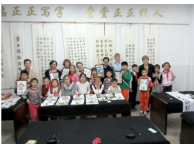
教育学院与南非院校合作办学