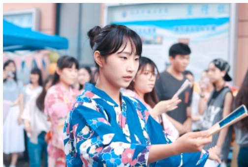
东语学院异域风情展

发挥学生团队多元、灵活的优势助力中国文化走出去。英文学院“微霖”国际支教团队创立四年来，始终秉承“中国文化走出去，外国文化引进来”的教学理念。连续四年在衢州穷实支教实践基地的同时，先后前往印尼巴厘岛、泰国清迈等地进行国际支