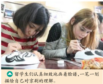
留学生们认真细致地画着脸谱,一笔一划描绘自己对京剧的理解。