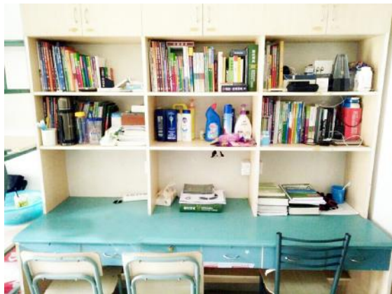
文明示范寝室一瞥