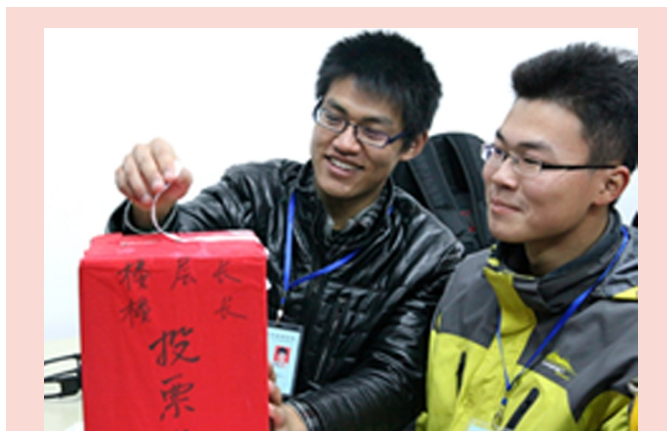
为进一步推进学生公寓管理与文明寝室建设,发挥学生自我教育、自我管理和自我服务功能,学校举行首届学生公寓楼长、楼层长选举。共选举产生楼层长50余名,并从中产生楼长10余名。(学生处)

本报讯 近日,我校拉丁美洲研究所举办第9期“拉美高级讲坛”。西班牙BBVA银行驻中国首席代表胡玉玮博士作了题为《西班牙金融危机:成因、影响和前景》的讲座。全校师生140余人参加了讲座。 胡玉玮从经济学家和金融从业人员的角度,深入剖析了西班牙金融危机爆发的原因,以及造成的经济影响和社会影响,对西班牙及欧洲金融危机未来的发展趋势作了预测。讲座后,胡玉玮与我 校师生进行了热烈的问答互动,结合自身留学、工作的经历,勉励同学们好好学习,熟练掌握外语,把握人生机遇。 胡玉玮获英国利兹大学经济学硕士学位、布鲁内尔大学经济学博士学位和牛津大学经济学博士后,曾在联合国经合组织(OECD)、欧盟委员会担任经济学家和中国问题专家,2010年3月起担任西班牙第二大银行——西班牙BBVA银行驻中国首席代表。 (拉美所 王双)