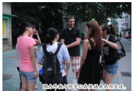
图为外教与同学们在英语角热烈交谈。

据悉,我校 266 名志愿者将在第八届全国残疾人运动会期间承担赛场辅助、物品管理、授旗引导、记者接待、综合安保等 11 项服务,共同履行当代大学生“奉献自我、回报社会”的使命。(沈波)