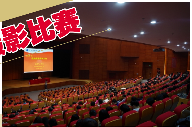
宏伟的 大学生 活动中心