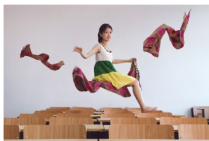
←我眼中的“欧亚学院”