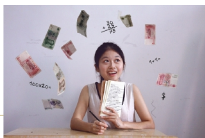
←我眼中的“国际工商管理学院”