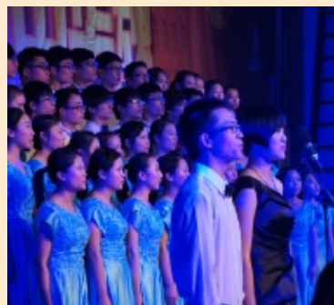
第四届“中国梦·中华魂”纪念“一二·九”学生运动大合唱比赛在校本部小礼堂举行。