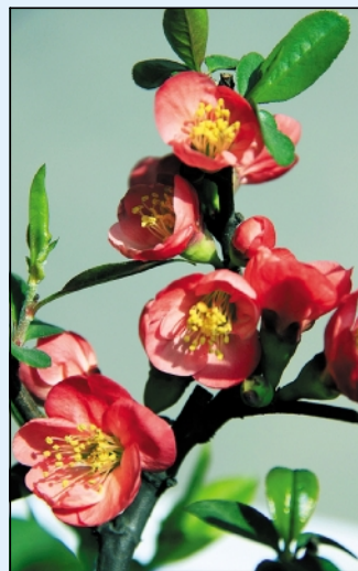
春天里(一)

这是我体会到的一些浅显的生活道理。《鬼谷子》的确需要我们去细细琢磨和品味。用心灵去看,用脑袋去想,用生活去实践。相信它会给我们带来更多的感悟。